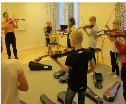
Pågående musikprojekt på Maria Elementar.