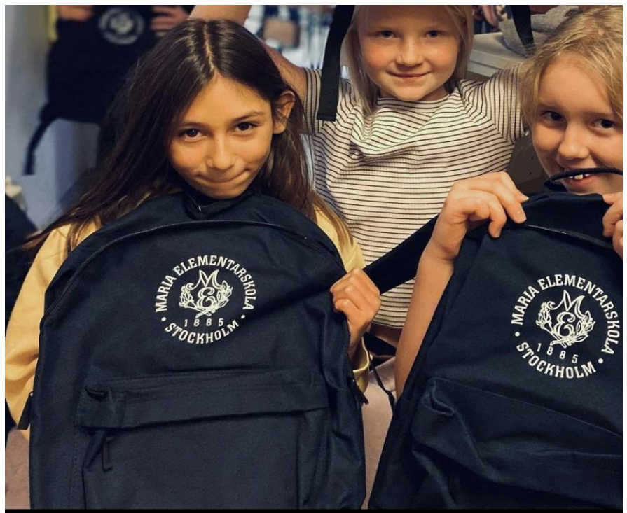
Bildtext: I november delade skolan ut gratis ryggsäckar till alla elever.