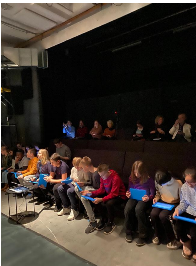
Klass 6A deltar i Techformance-projekt.